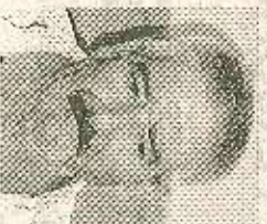
Cayo Vega Guardián