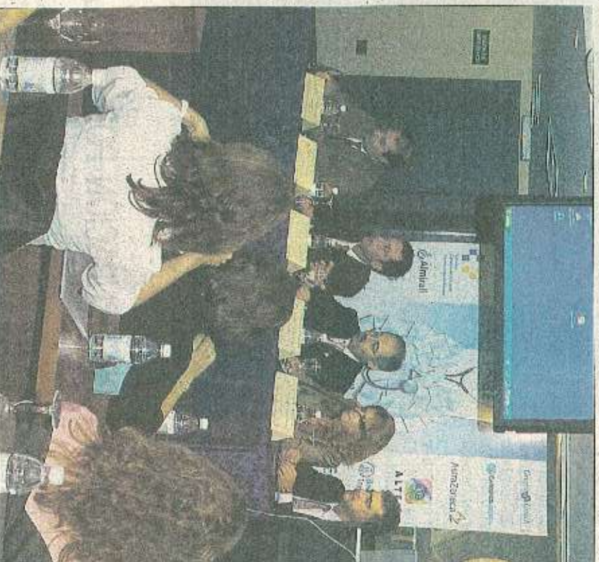
Congreso. Imagen de un instante del encuentro, ayer, en el Hotel AC.